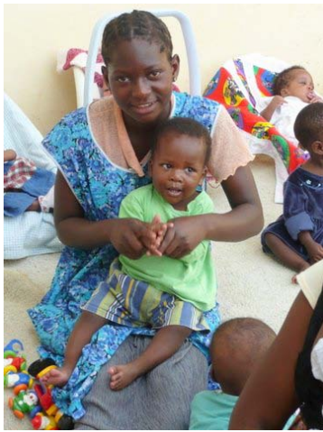
Liefde en plezier