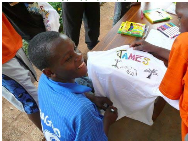
James kan trots zijn....