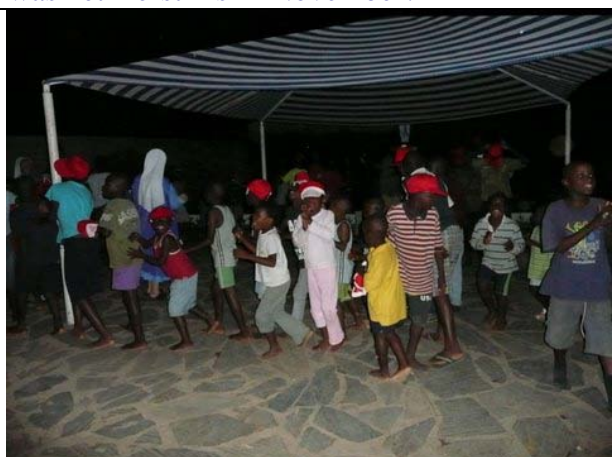
Het spontane feest