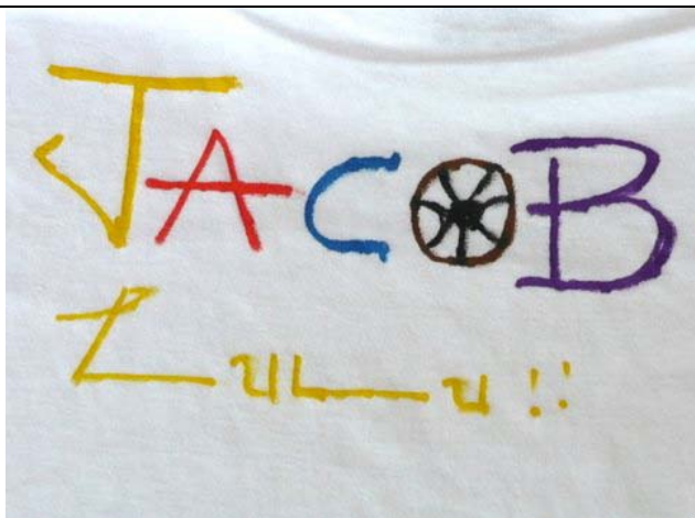
Jacob is een zeer creatieve jongen