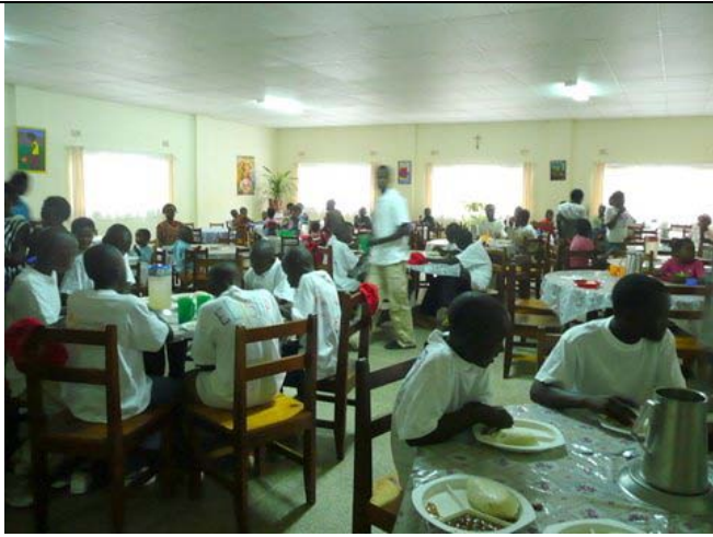
(above) Lunch at new dining room. (right) Fresh vegetables from Kasisi's own vegetable garden