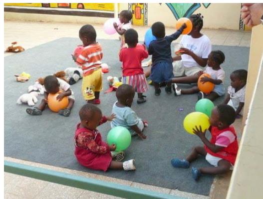
Speelplaats voor de kleintjes