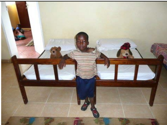
Trots op z'n bed Goodbye op Lusaka Airport