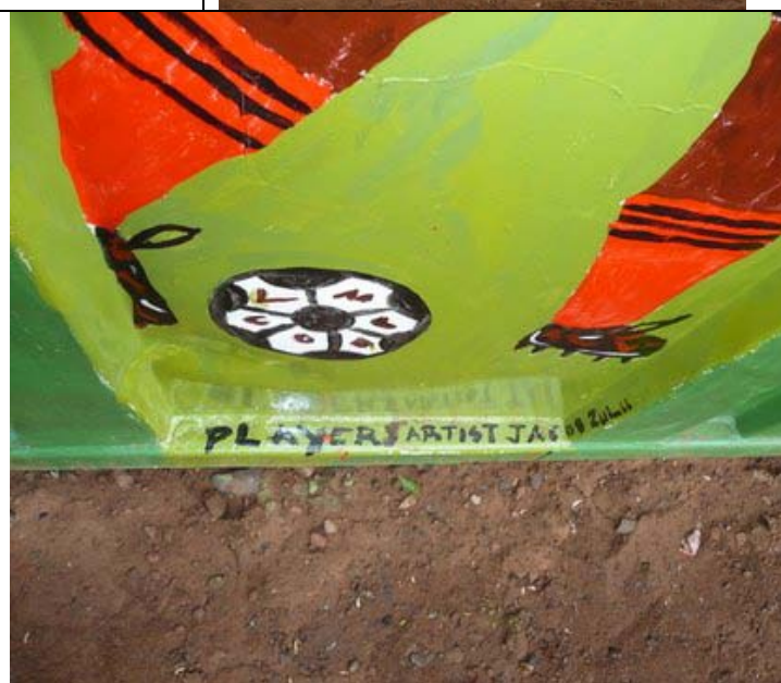
The artist? JACOB ZULU

Hopelijk hebt u deze nieuwsbrief met plezier gelezen.