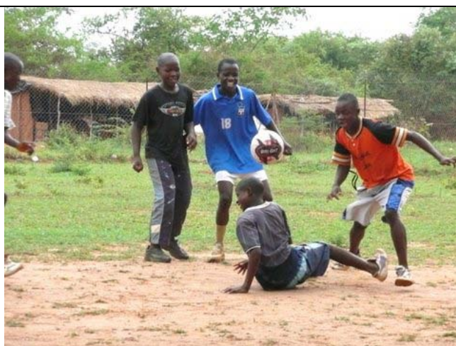
Heel gelukkig met hun nieuwe voetbal....

Tijdens onze laatste avond hebben we op een binnenplaats ‘vingerlichtjes’ (kleine discolampjes) uitgedeeld aan alle kinderen en mammies (zo noemen de kinderen hun Zambiaanse verzorgsters). Iedereen was hierdoor zo verrast, dat er spontaan een vreugdedans uitbrak. Men zong, danste en er werd muziek gemaakt (trommels, tamboerijnen). Een compleet spontaan feest. Het was net Kerstmis in November!