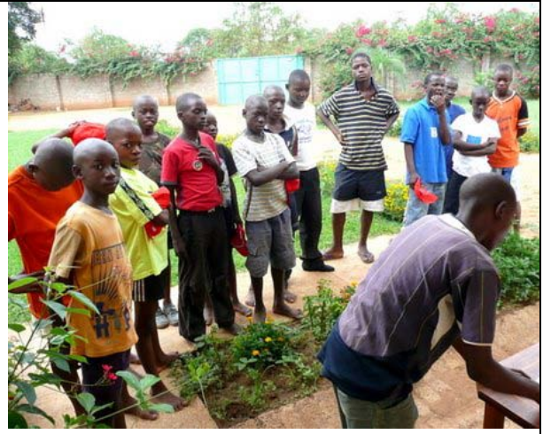
De rest van de jongens wachten geduldig op hun beurt...