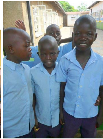
Jongens komen uit school