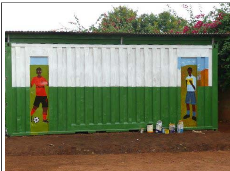
On the spot where the extra boy's house will be built, this container has been placed as a storage.