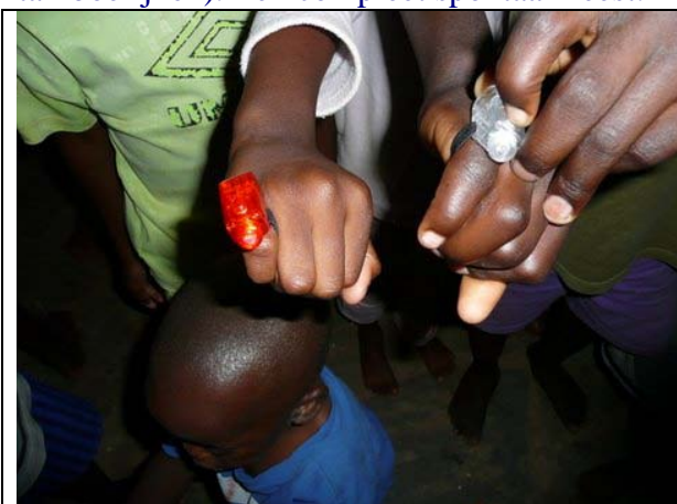
kleine disco lampjes

Tijdens onze laatste avond hebben we op een binnenplaats ‘vingerlichtjes’ (kleine discolampjes) uitgedeeld aan alle kinderen en mammies (zo noemen de kinderen hun Zambiaanse verzorgsters). Iedereen was hierdoor zo verrast, dat er spontaan een vreugdedans uitbrak. Men zong, danste en er werd muziek gemaakt (trommels, tamboerijnen). Een compleet spontaan feest. Het was net Kerstmis in November!